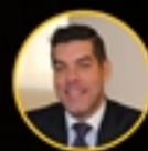
RAÚL LEDESMA Ministro de Ambiente