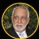
CARLOS PÉREZ Ministro de Energía y Recursos Naturales No Renovables