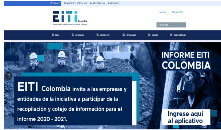
Información divulgada sistemáticamente